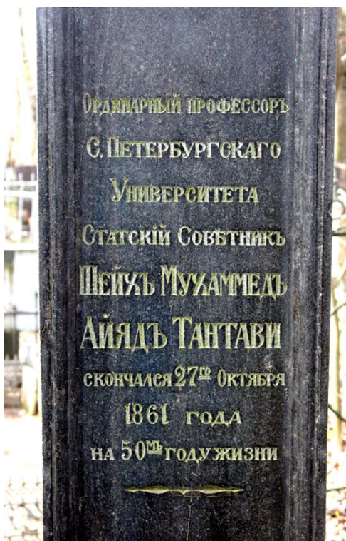
Надгробный памятник Шейху Тантави на Волковом кладбище в Санкт-Петербурге: эпитафия на русском языке.

Там Шейх из мусульман прижимает к груди своей Анну...» 1 .