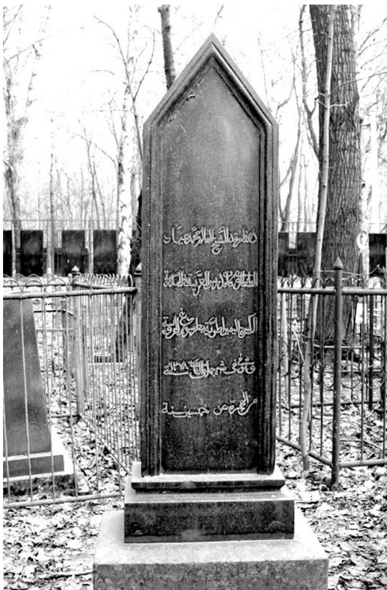
Мои́ла Шейха Тантави на Волковом кладбище в С.-Петербурге.