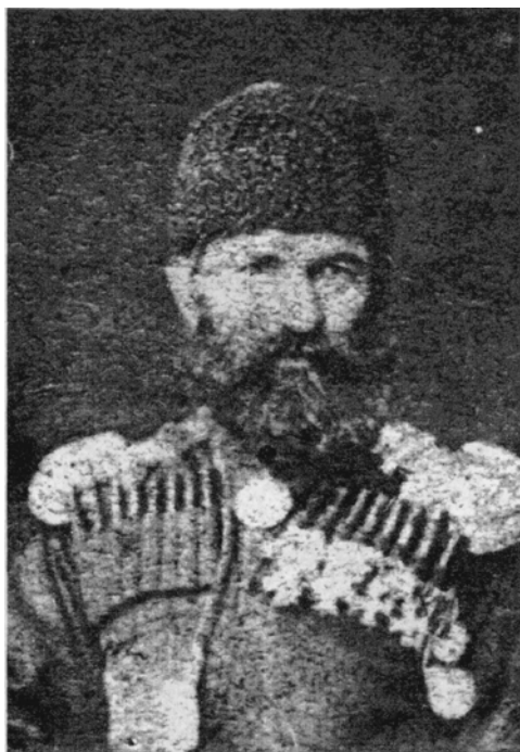
Рис.2. «Посмертная фотография» Гаджи-Али

Вероятно, чтобы окончательно сбить нас с толку, в игру вступает еще один источник. В 1882 г. Хаджи-‘Али со своим сыном Мухаммад-Шарифом непонятным образом появляется на изданной в Дагестане фото-виньетке среди чиновников военнопленного управления 3 (см. рис.2). Сохранилась реляция о награждении Мухам-